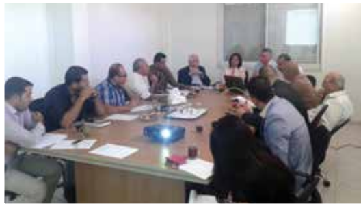
Solid Waste Management Master Plan

A "Solid Waste Management Project for Bethlehem Governorate" Master Plan has been completed. Given the need to build a sustainable framework for Solid Waste Management, the project will follow three phases for the proposed strategy. These include the development and early operation of the new waste collection systems, the implementation of technical assistance programs and the development of sustainable SWM systems.